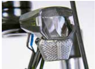
Frontreflektor am Front-Scheinwerfer

regelmäßig toleriert wird, sagt dies nichts über deren trotzdem verpflichtenden Charakter aus. Ein Reflektoren-Set wird standardmäßig mitgeliefert und bei Rennrädern