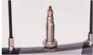
Französisches oder Sclaverand-Ventil

dass keine Luft entweicht. Das Sclaverand-Ventil hält auch bei hohem Druck sicher dicht.