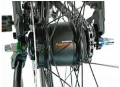
Schraubachse an einer Nabenschaltung.

Schraubachsen sind bei Laufrädern mit Nabenschaltung üblich. Sie lassen sich einfach und sicher bedienen und sorgen für einen festen Halt des Hinterrades im Rahmen.