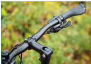
Die Gänge lassen sich bequem mit Druck und einem Finger wechseln.