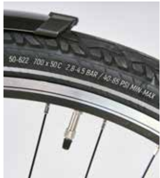
An der Seitenwand eines Reifens finden sich verschiedene Größenangaben.

Reifen- und Felgenbreite müssen zueinander passen, was vor allem beim Austausch zu beachten ist: Ein zu breiter Reifen kann vor allem bei zu geringem Druck in der Kurve merklich wegnicken. Auf besonders breiten Felgen, etwa für Mountainbikes, dürfen keine zu schmalen Reifen montiert werden, da diese unter Umständen nicht sicher im Felgenbett halten.