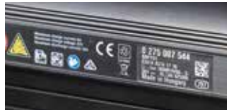
Bild oben: Neben den „Wattstunden“ enthält das „Kleingedruckte“ auf dem Akku eine Seriennummer und die CE-Kennzeichnung.

Generell können Sie Ihr E-Bike wie jedes normale Fahrrad transportieren, durch das leicht erhöhte Gewicht eignet sich der Dachgepäckträger für's Auto allerdings nicht. Besser: ein Heckträger. Den Akku muss während der Fahrt separat im Kofferraum aufbewahrt werden.