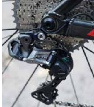
Elektronisches Schaltwerk der Shimano GRX-Schaltung fürs Gravelbike.

Elektronische Schaltungen finden immer mehr Einzug in die Fahrradwelt. Dabei werden die Gangwechsel mit Stellmotoren statt mechanisch per Seilzug ausgeführt. Shimano bietet mit der elektronischen „Di2“ elektronische Systeme für Naben- und Kettenschaltungen an. SRAM hat mit den „AXS“ Komponenten kabellose Ketten-Schaltssysteme im Programm. Die Stromversorgung erfolgt jeweils über kleine Akkus – an E-Bikes werden die Schaltgruppen mitunter über den Rahmenakku versorgt.