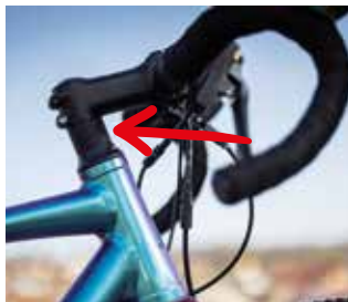
Mit sogenannten „Spacern“ lässt sich die Höhe des Vorbaus leicht anpassen.

Zu Fahrkomfort und Ergonomie tragen Form und Breite des Lenkers einen großen Anteil bei. Tourenlenker mit zum Fahrer hin abgewinkelten Griffenden erlauben eine entspannte Position von Schultern und Händen; weitgehend gerade Mountainbike-Lenker sorgen für ein wesentlich direkteres Lenkverhalten