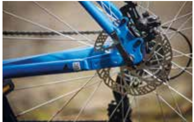
Schnellspannachsen lassen sich schnell öffnen.

Schnellspannachsen kommen vorzugsweise bei Sporträdern mit Kettenschaltung zum Einsatz, etwa am Rennrad oder am Trekking-Bike. Durch die Vorspannung der Achse sorgen sie für festen Halt des Laufrades in Rahmen und Gabel.