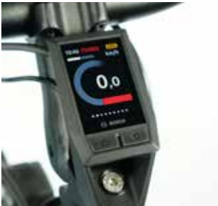
Kiox-Display mit vielen Funktionen.