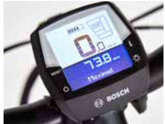
Der Klassiker: Intuvia-Display von Bosch.