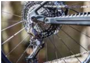
Kettenschaltungen eignen sich für häufige und schnelle Gangwechsel.

Je besser und moderner die Schaltung ist, desto mehr Ritzel gibt es hinten – aktuell bis zu zwölf, die sich schnell durchschalten lassen. Einfachere Systeme, etwa mit 3×8 Gängen, weisen ebenfalls einen großen Übersetzungsumfang auf, sind aber nicht so einfach zu bedienen, da oft gleichzeitig vorne geschaltet werden muss. Topmodern sind elektronische Schaltsysteme mit Signalübertragung per Kabel oder per Funk, die durch dauerhaft präzise Gangwechsel überzeugen. Pflege ist dennoch wichtig, da alle technischen Bauteile der Schaltung frei liegen und der Witterung ausgesetzt sind.