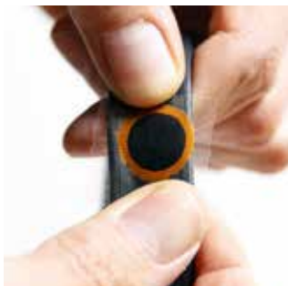
Schritt 3: Flicker auflegen und gleichmäßig andrücken.

Ein Klassiker der Fahrradwelt: Flickzeug von TipTop