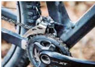
Der vordere Umwerfer wechselt die Kette zwischen den Kettenblättern.