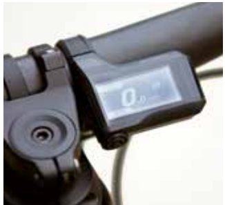
Das minimalistische Shimano-Display