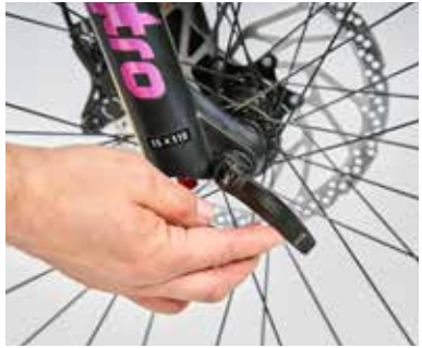
Steckachsen fixieren ein Laufrad optimal.

Aktuell gibt es bei Laufrädern drei unterschiedliche Montagestandards. Das Optimum bei Fahrrädern und E-Bikes mit Scheibenbremsen sind Steckachsen, die durch die Ausfallenden geschoben und in Rahmen und Gabel verschraubt werden; sie fixieren das Laufrad und sorgen für eine optimale Ausrichtung der Bremscheiben.