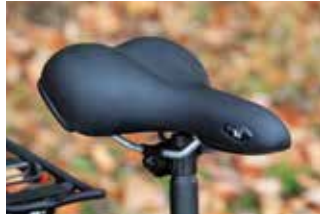
Ein Tourensattel mit Gel-Polster.

Da das Komfort-Empfinden in Bezug auf den Sattel sehr individuell ist, sind meist nicht mehr als