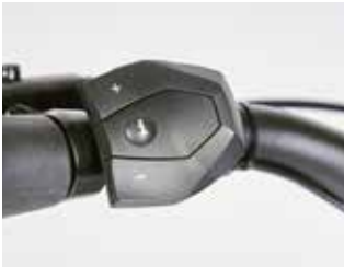
Alle Funktionen sind bequem zu steuern.

durchschalten lassen. Die Informationsbandbreite variiert je nach System und Ausführung; manche Displays können etwa als Navigationsgerät genutzt werden und lassen sich mit einem Smartphone koppeln. Andere bieten nur Basisinformationen, was vielen Nutzern etwa im Alltagseinsatz genügt.