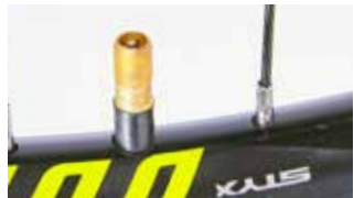
Schrader oder Autoventil

Das Schrader-Ventil wird aus naheliegenderm Grund auch Autoventil genannt; es hat aus den USA den Weg zum Fahrrad gefunden und ist gerade im unteren Preispereich beliebt. Zum Befüllen muss die Pumpe so fest aufgesteckt werden, dass der Stift, der das Ventil öffnet, heruntergedrückt wird. Vorsicht, wenn ein Reifenfüllgerät an der Tankstelle genutzt wird: Aufgrund des geringen Volumens kann ein Fahrradreifen dabei schnell platzen!