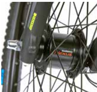
Nabendynamo am Vorderrad