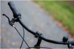
City- und Tourenlenker