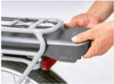
Gepäckträgerakkus lassen sich gut entnehmen.

Die elektrische Batterie des Antriebssystems wird bei den meisten modernen E-Bikes im Rahmen integriert; alternativ ist sie an Unter- oder Sitzrohr oder am Gepäckträger platziert. Die in Wattstunden (Wh) angegebene Kapazität ist das Maß für die Reichweite: So kann man mit 500 Wh rein rechnerisch zwei