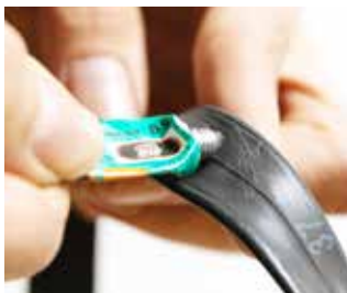
Schritt 2: Vulkanisierflüssigkeit dünn auftragen