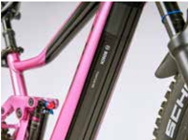
Schön im Unterrohr versteckt: Intube-System.

Stunden lang eine Leistung von 250 Watt abrufen.