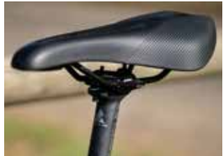
Längerer und schmalerer Sportsattel.

grundlegende Ratschläge angebracht. Die ZEG-Fachhändler montieren ihren Kunden aber testweise Sättel oder tauschen nicht passende Modelle um.