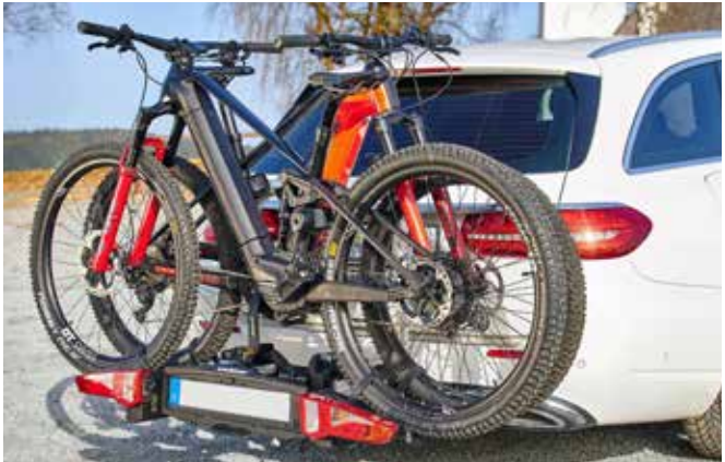
Bild unten: Auf einem Träger für die Anhängerkupplung lassen sich auch E-Bikes sicher transportieren – maximale Zuladung beachten!

Die Multiplikation beider Werte ergibt die gespeicherte Energie im Akku; also bspw. 36\text{ V} \times 17\text{ Ah} = 612\text{ Wh} .