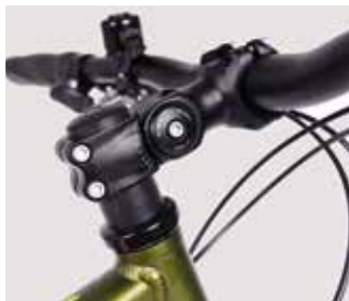
Am Tourenbike beliebt ist die Möglichkeit, den Winkel am Vorbau zu verstellen.

Schaft- wie Ahead-Vorbauten gibt es auch in Varianten, die mit einem Drehgelenk zur Winkelverstellung ausgestattet sind.