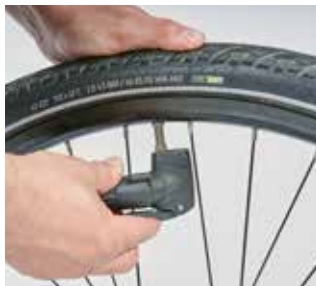
Eine kleine Handpumpe sollten Sie unterwegs dabei haben.

sondern besser versucht werden, noch ein wenig weiter zu kommen. Bei zu großem Luftverlust wird der Reifen schwammig, außerdem kann er aus dem Felgenbett rutschen. In diesem Fall darf man keinesfalls weiterfahren – einerseits wird der Reifen beschädigt, andererseits ist die Sturzgefahr zu hoch.