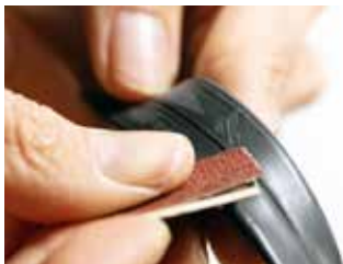
Schritt 1: Schadstelle aufrauen