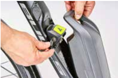
Der klassische Rahmenakku – hier von Bosch.