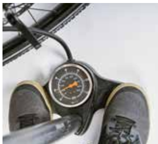
Eine Standpumpe mit Manometer sollte zur Grundausrüstung gehören.

Moderne Fahrradreifen sind sehr pannensicher; spitze Glassplitter oder ein Nagel können aber dennoch zum Defekt führen. Macht sich schleichender Luftverlust durch einen eingedrungenen Fremdkörper bemerkbar, sollte dieser nicht rausgezogen werden,