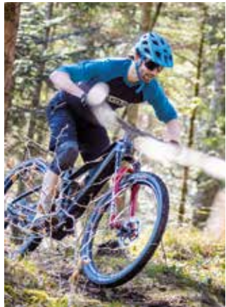
Tubeless erfreut sportliche Fahrer mit mehr Dämpfung und Bodenhaftung.

Die Montage aktueller Systeme ist vergleichsweise einfach; sitzt der Reifen nicht rundum dicht in der Felge, kann es jedoch nötig werden, ihn mit einem Kompressor oder einer Druckluftpumpe zu befüllen. Für die Alltagsnutzung sind Tubeless-Reifen (noch) nicht unbedingt geeignet, da sie öfter nachgepumpt werden müssen als konventionelle Reifen mit Schlauch.