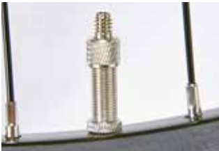
Dunlop- oder Blitzventil

Gleich drei unterschiedliche Ventiltypen finden sich an Fahrrädern und E-Bikes. Der Klassiker ist das Dunlop- oder Blitzventil , das beim entsprechenden Schlauch in den Ventilschaft gesteckt und per Überwurfmutter befestigt wird. Es lässt sich leicht mit handelsüblichen Pumpen bedienen, zumal bei der Handhabung keine Luft entweichen kann, und ist besonders bei Touren- und Alltagsrädern zu finden.