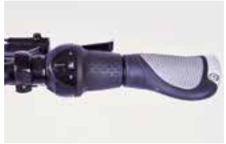
Ergonomischer Griff mit Drehschaltung

An Fahrrädern ( Achtung: nicht an E-Bikes oder S-Pedelecs! ) ist der Tausch des Lenkers gegen eine Ausführung mit abweichender Form meist kein Problem – so kann bspw. ein eher sportlich orientiertes Bike komfortabel abgestimmt werden.