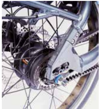
Ein Zahnriemen als Alternative zur Kette ist leise, sauber und fast wartungsfrei, bedarf aber eines speziellen Rahmens, da dieser, anders als eine Kette nicht geöffnet werden kann.

Getriebschaltungen können mit einem Zahnriemenantrieb kombiniert werden, der die Fahrradkette ersetzt und ziemlich praktisch ist: Der Riemen muss nicht geölt und gereinigt werden. Er läuft viel Jahre geschmeidig und verschleißfrei. Nötig ist ein spezieller Rahmen, der zur Montage des Riemens geöffnet werden kann, außerdem muss auf die korrekte Riemenspannung geachtet werden.